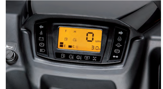
Tableau de bord avec affichage numérique

La servodirection hydrostatique réactive vous garantit un maximum de contrôle sans effort pour affronter n'importe quel terrain. Le volant s'ajuste en inclinaison, pour permettre à chacun d'effectuer ses réglages en fonction de sa morphologie.